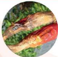
Bệnh thán thư ớt