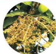
Bệnh thán thư xoài