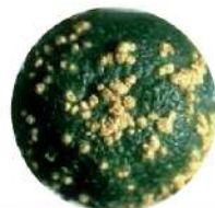
Bệnh ghẻ sẹo