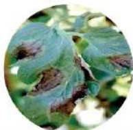
Bệnh sương mai dưa hấu

Cabrio® Top 600WG là thuốc trừ bệnh thể hệ mới có hiệu lực cao, chặn đứng tức thời, diệt triệt để nấm bệnh, đồng thời phòng bệnh kéo dài. Cabrio® Top 600WG có đặc tính AgCelence giúp cây nhanh chóng phục hồi sau khi bệnh, cho năng suất cao.