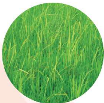
Bệnh lúa von

Polyram® 80WG có phổ tác dụng rất rộng, tác động tiếp xúc và bám dính tốt, kháng rửa trôi nên phòng trừ hữu hiệu cùng lúc nhiều loại nấm bệnh. Nhờ phụ gia tiên tiến, Polyram® 80WG có thể diệt trừ cả nấm bệnh lưu tồn trong đất, bảo vệ an toàn bộ rễ, mầm và lá cây non. Polyram® 80WG chứa hàm lượng kẽm dễ tiêu cao giúp cây tăng cường khả năng quang hợp, lá xanh, tăng sức đề kháng.