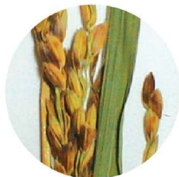
Hạt lúa von